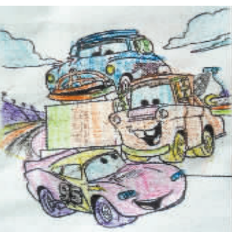
▲ 小记者:翟翟 编号:170851 学校:周口实验小学二(1)班