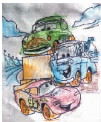
▲ 小记者:省恩光 编号:171658 学校:周口七一路一小五(3)班