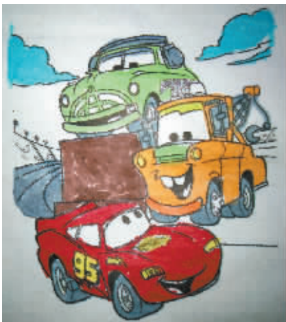
▲ 小记者:王乙帆 编号:171451 学校:周口闫庄小学三(2)班

小记者,你是否常常想画一幅漂亮的画,可是却苦于无从下笔?本期开始,小记者填色游戏火热来袭,小伙伴们快来填涂属于自己的“秘密花园”吧。作品涂好后,可用相机或者手机将其拍下来发至 zkwbxjz@126.com,写清姓名、编号、学校班级,请注意图片格式和清晰度,本报将选取较好的作品在下期《小记者报》和小记者微信平台集中展示。