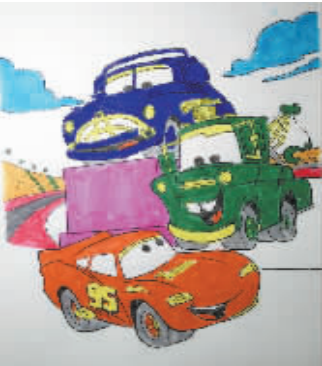
▲ 小记者:王烁 编号:170649 学校:周口七一路二小五(4)班