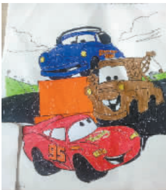
▲ 小记者:陈依涵 编号:170849 学校:周口实验小学二(1)班