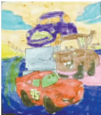
▲ 小记者:钟明瑞 编号:170371 学校:周口七一路二小二(4)班