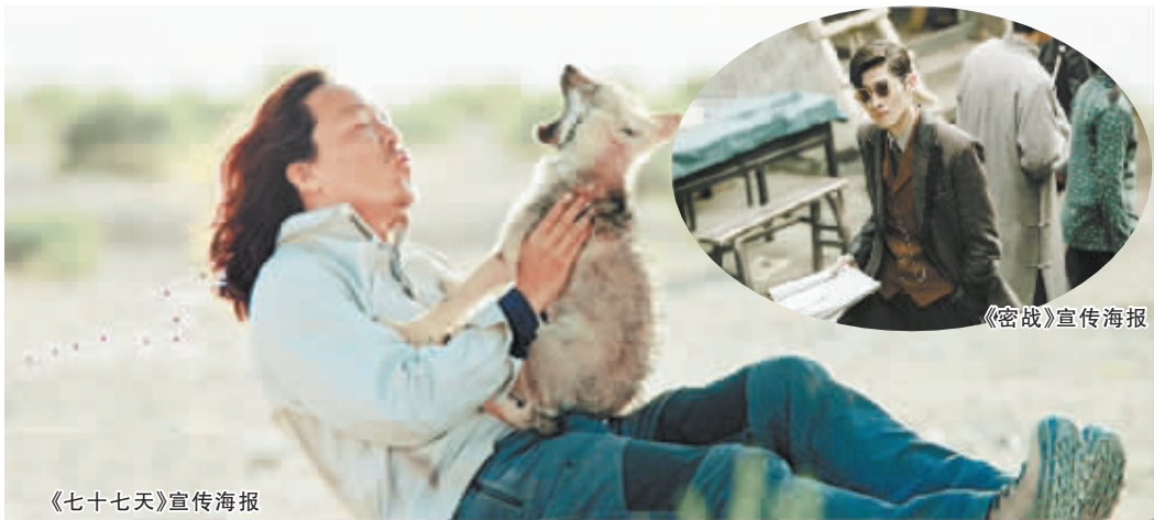
《七十七天》宣传海报