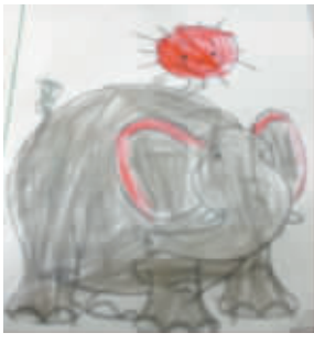
小记者：赵传钰 编号：170126 学校：周口莲花路小学三（2）班