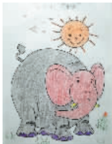
小记者：周轩宇 编号：170303 学校：周口七一路二小二（3）班