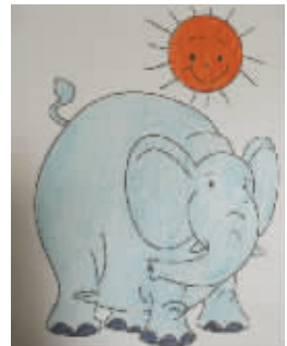
小记者：马超然 编号：172288 学校：周口六一路小学三（7）班