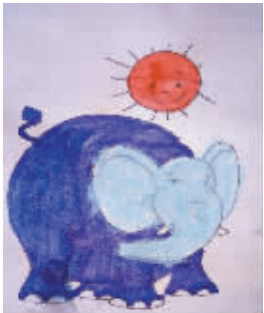
小记者：王思瑶 编号：170848 学校：周口实验小学二（1）班