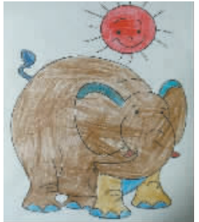
小记者：赵浩俊 编号：176222 学校：融辉黄冈学校四（2）班