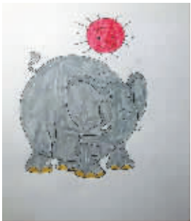
小记者：王烁 编号：170649 学校：周口七一路二小五（4）班