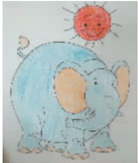
小记者：邢滨宇 编号：170398 学校：周口七一路二小二（4）班