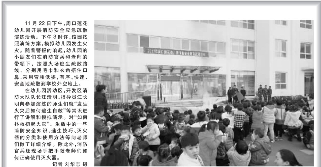
11月22日下午,周口莲花幼儿园开展消防安全应急疏散演练活动。下午3时许,该园按照演练方案,模拟幼儿园发生火灾。随着警报的响起,幼儿园的小朋友们在消防官兵和老师的带领下,按照火场逃生疏散路线,分别用毛巾和衣角捂住口鼻,采用弯腰低姿,有序、快速、安全地疏散到学校外空地上。

园要进一步加强幼儿园风险管控,强化准入管理,强化技术手段监管,形成常态化监管工作机制。建立和完善幼儿园突发事件应急处理问责机制,明确相关责任,对因管理不到位造成重大事故或造成恶劣社会影响的,要依法追究有关责任人责任。 通知同时要求,各地要建立幼儿园办园行为常态监测机制,及时了解幼儿园办园行为和基本运行情况,按要求报送相关数据信息。特别是对重大事件要妥善处理,及时上报,保障幼儿园不断规范管理,健康发展。