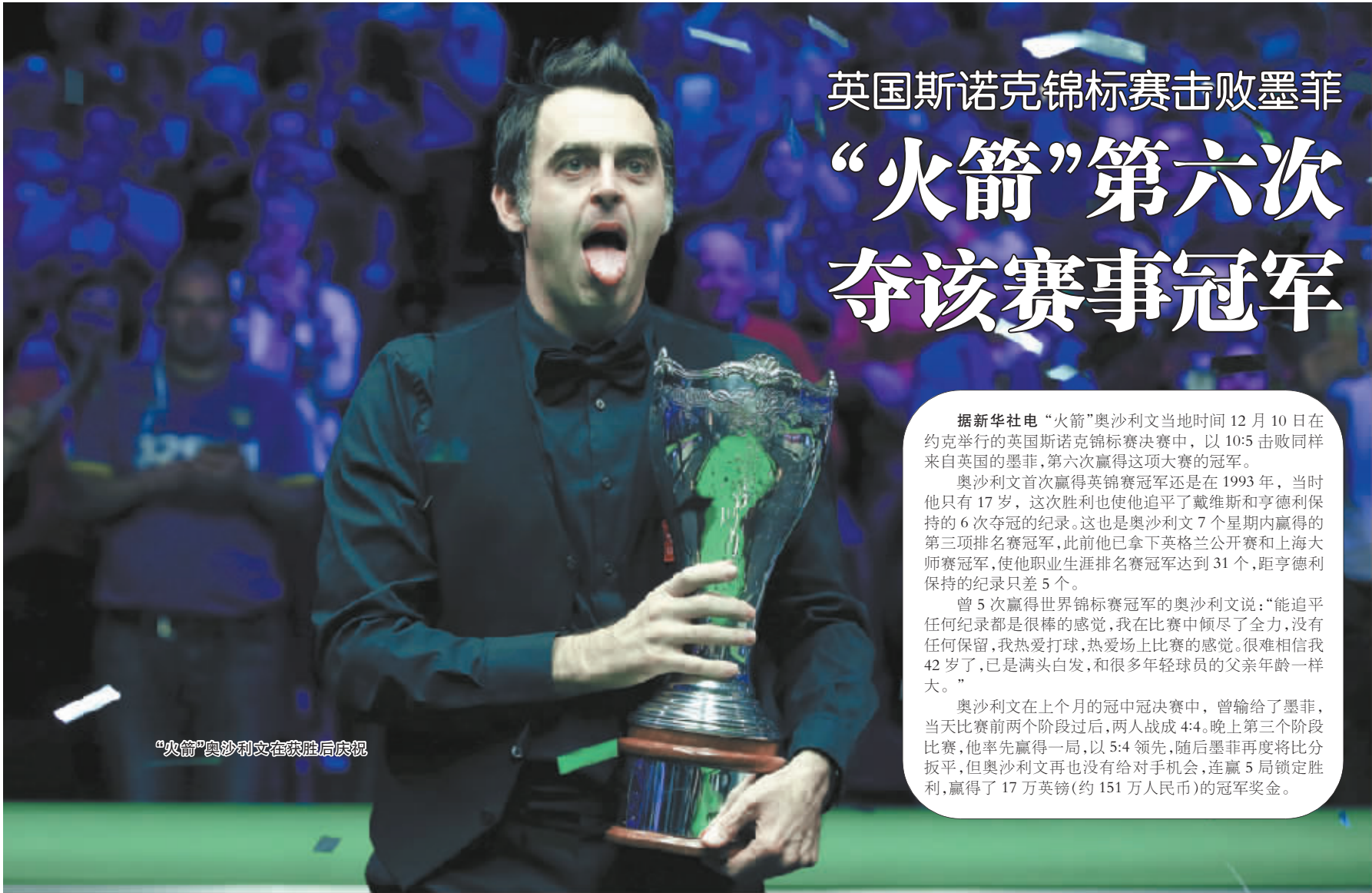
“火箭”奥沙利文在获胜后庆祝